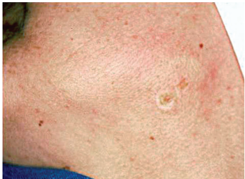
Foto 5. Posoperatorio inmediato.