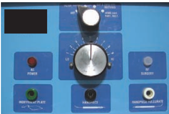
Foto 2. Frente de un aparato de radiofrecuencia moderno.