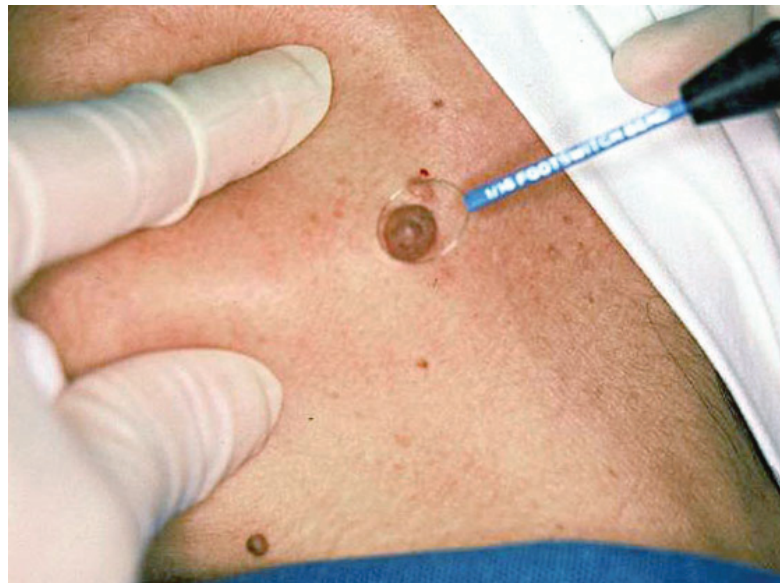
Foto 4. Nevo celular, destrucción por radiofrecuencia con punta en asa.