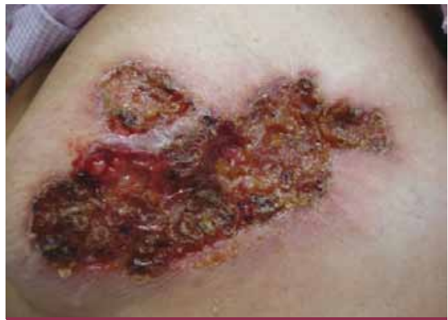
Foto 4. Caso 7. Úlcera de bordes irregulares, fondo en sectores vegetante que alternan con áreas de necrosis cubiertas por costras hemáticas y melicéricas.