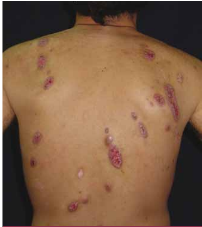
Foto 3. Caso 5. Múltiples úlceras superficiales de bordes sobreelevados, con fondo en sectores vegetante. Cicatrices cribiformes.

Mujer de 56 años, oriunda de Buenos Aires. Consultó por dos úlceras dolorosas, la mayor de 14 por 8 cm, de bordes irregulares, eritematovioláceos, fondo en sectores vegetante, que alternaban con focos de necrosis, cubierto por costras hemáticas y melicéricas localizadas en la mama izquierda, de 3 años de evolución (foto 4). Como antecedente refería la extirpación de un nódulo en dicha mama, cuya cicatriz quirúrgica presentó una evolución tórpida, por lo que, un año después, se realizó la resección de la misma, la areola y el pezón, con mala evolución. El estudio histopatológico fue compatible con PGV (fotos 5 y 6). Se realizó terapia antibiótica durante 10 días, por la sobreinfección que presentaba, luego se instauró metilprednisona 40 mg/día y minociclina 200 mg/d con resolución completa de la lesión a los 5 meses.