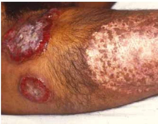
Foto 1. Caso 1. Placas ulceradas dolorosas y cicatrices atróficas hipo e hiperpigmentadas.