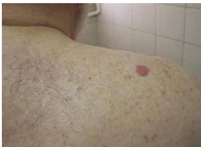
Foto 1. Placa eritematosa en hombro derecho.