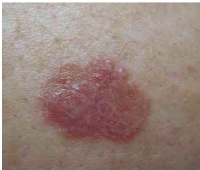
Foto 2. Placa eritematosa, de bordes perlados, superficie brillante y estrías blanquecinas.