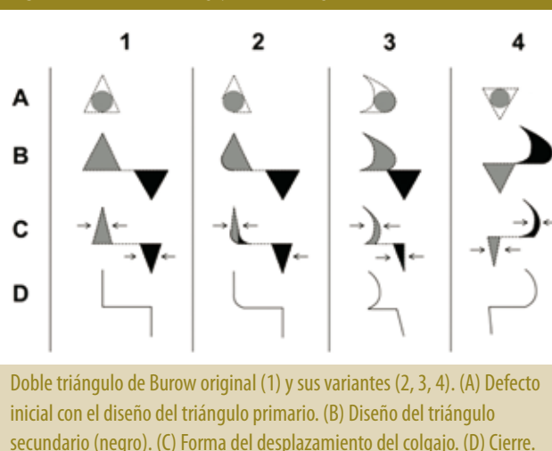
Figura 1. Variantes del colgajo doble triángulo de Burow.

Doble triángulo de Burow original (1) y sus variantes (2, 3, 4). (A) Defecto inicial con el diseño del triángulo primario. (B) Diseño del triángulo secundario (negro). (C) Forma del desplazamiento del colgajo. (D) Cierre.