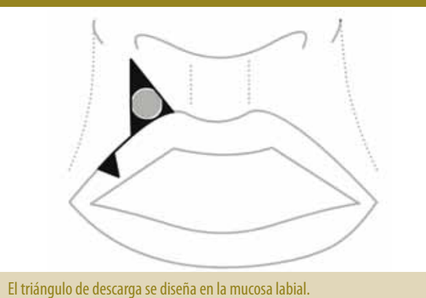
Figura 3. Modificación de Dang y Greenbaum.

El triángulo de descarga se diseña en la mucosa labial.