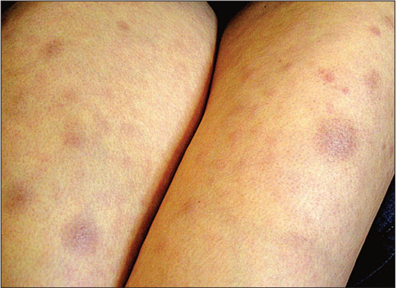
Foto 2. Nódulos equimóticos en miembros inferiores.