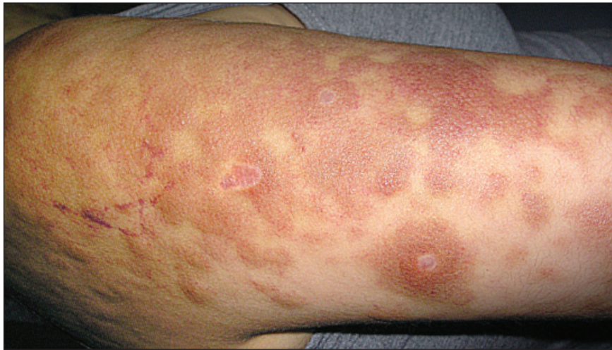
Foto 1. Placas infiltradas en miembros superiores.

Fecha de recepción: 28/11/07 | Fecha de aprobación: 20/12/07