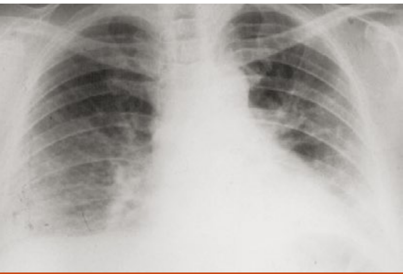
Fig. 1. Radiografía de tórax compatible con enfermedad intersticial.

Si bien en la mayoría de las series publicadas, los pacientes con SAS se clasifican de acuerdo con los criterios de Bohan y Peter de las miopatías inflamatorias, Imbert-Masseau et al. 5 describen los hallazgos histopatológicos de biopsias muscu-