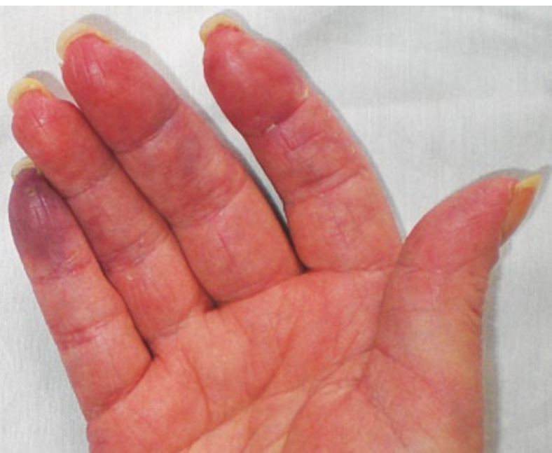
Fig 2. Fenómeno de Raynaud.

lares realizadas en pacientes con SAS, en las cuales hallaron compromiso predominantemente del tejido conectivo perimisial, el cual muestra fragmentación e infiltrado inflamatorio principalmente macrofágico, y sin afección de las regiones endomisial y perivascular, a diferencia del patrón que se describe en las MII, en las cuales la inflamación afecta especialmente el endomisio y la región perivascular.