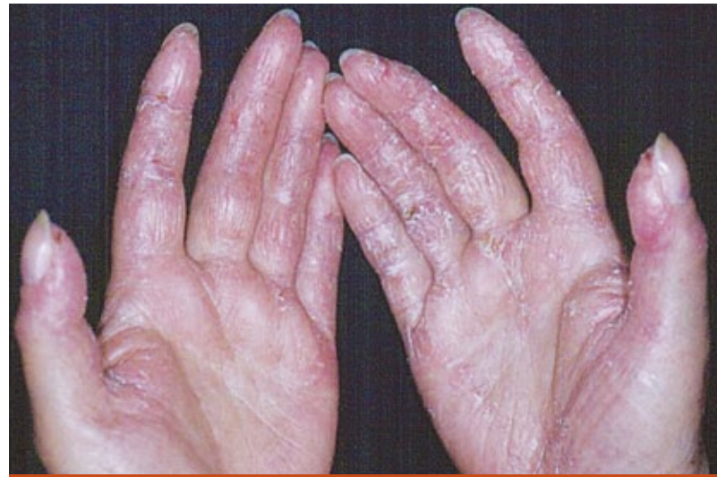
Fig. 3. “Manos de mecánico”. Eritema, descamación y fisuras.

Dentro de los hallazgos de laboratorio, se describe la presencia de AEM como los ACAS, los cuales se hallan en el 20-40% de pacientes adultos con PM y en el 5% de pacientes con DM. 17 En los estudios de inmunofluorescencia para anticuerpos antinucleares (ANA) utilizando como sustrato