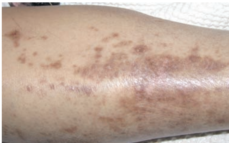
Foto 1. Atrofia parda circumscripita pretibial.

fue diagnosticada por oftalmoscopia, la nefropatía por la presencia de proteinuria y la neuropatía periférica por la presencia de un índice positivo (tres complicaciones derivadas de la microangiopatía). El adecuado control metabólico no pudo ser documentado debido a la falta de disponibilidad de HbA1c en nuestro hospital.