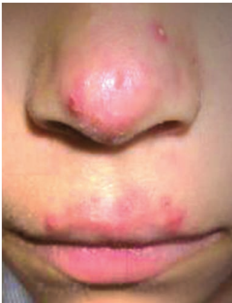
Foto 1. Lesiones perinasales y periorales.

En los pacientes que utilizaron corticoides tópicos no se observó ninguna localización predominante de las lesiones.