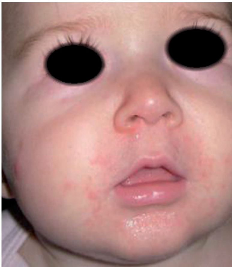
Foto 3. Lesiones periorales.