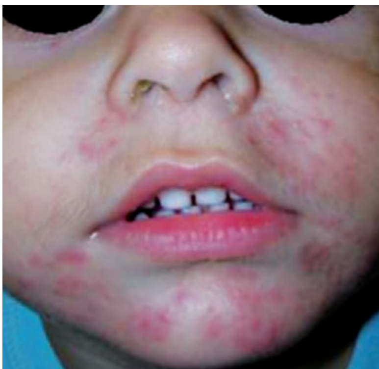
Foto 4. Lesiones periorales.

que otros efectos adversos como atrofia, telangiectasias, estrías, rosácea, acné por corticoides, hipopigmentación e hipertrichosis. 8 En nuestro estudio, el 66,6% de los pacientes tenía antecedentes de uso de corticoides. En el grupo de pacientes que utilizaron corticoides inhalatorios se observó que las lesiones se localizaban preferentemente en la región perioral, a la que sigue la perioral más la perinasal; ello puede estar relacionado con el uso de aerocámaras o máscaras para nebulizar. También observamos que las lesiones se produjeron en menor tiempo al utilizar corticoides en forma tópica.