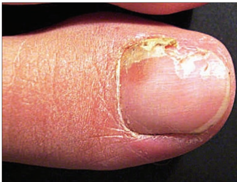
Foto 3. Onicomicosis lateral subungueal producida por Fusarium spp., en una joven de 25 años sin factores predisponentes.