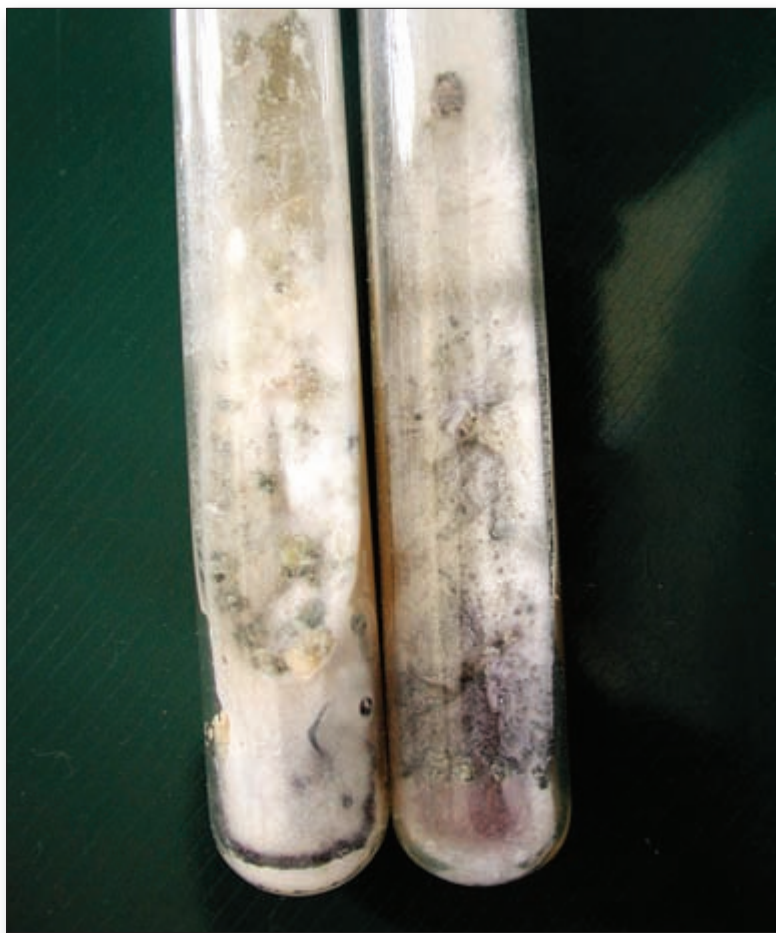
Foto 1. Macroscopia de colonias de Fusarium spp. en medios de Sabouraud y lactrimel sembrados con material de uñas de pie.