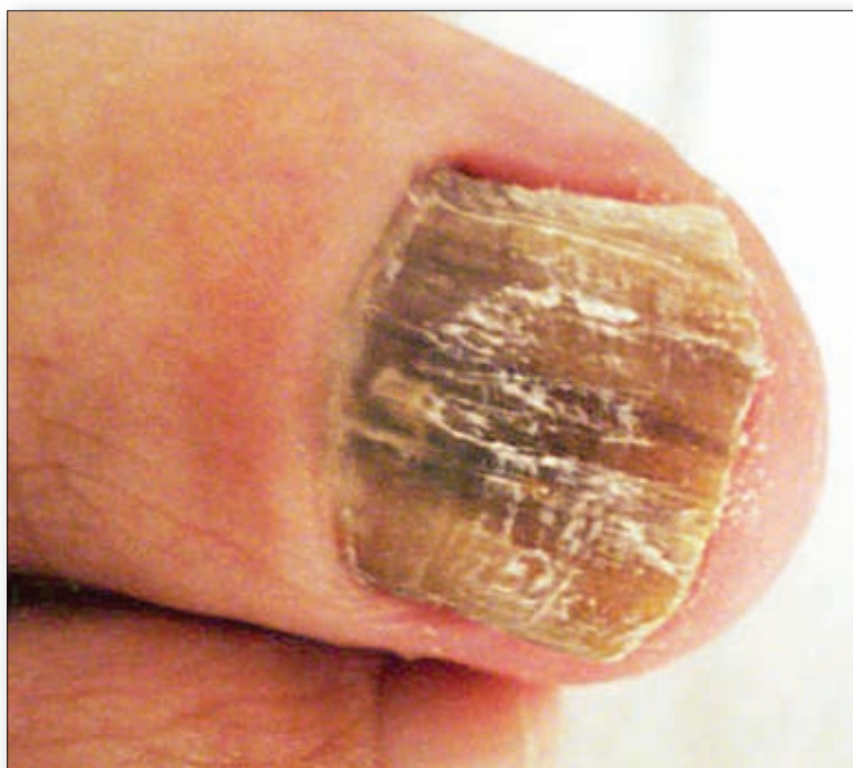
Foto 4. Profunda onicolisis de la uña del hallux con hematomas, en una mujer de 63 años con trauma ortopédico, en la cual se aisló Aspergillus flavus en dos oportunidades.

La mayor parte de los estudios señalan que las onicomicosis por HMHD son más frecuentes en las uñas de los pies, particularmente en las de los hallux y que afectan a adultos de ambos sexos y son muy raras en la infancia. 6,7,9,11-13,20,21,26,27,32 En nuestro estudio todos los pacientes eran adultos, con una edad promedio de 49,5 años, sin diferencias significativas en relación al sexo; el 88,7% de los casos tenían lesiones en las uñas de los pies y de ellos el 45,6% tenían compromiso sólo en las uñas de los ortijos mayores. Esto hace suponer que el factor traumático desempeña un papel importante en el comienzo de la infección.