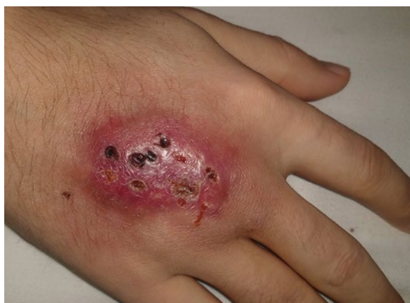
FOTO 1: Lesión nodular eritematosa con múltiples bocas de drenaje en el dorso de la mano derecha.

Se arribó al diagnóstico de pseudomicetoma tuberculoso con compromiso óseo en la mano asociado a TB pulmonar e intestinal. Se indicó tratamiento con isoniacida, rifampicina, etambutol y pirazinamida por 2 meses, para luego continuar con isoniacida y rifampicina por 7 meses debido al compromiso óseo. El paciente no concurrió a los controles.