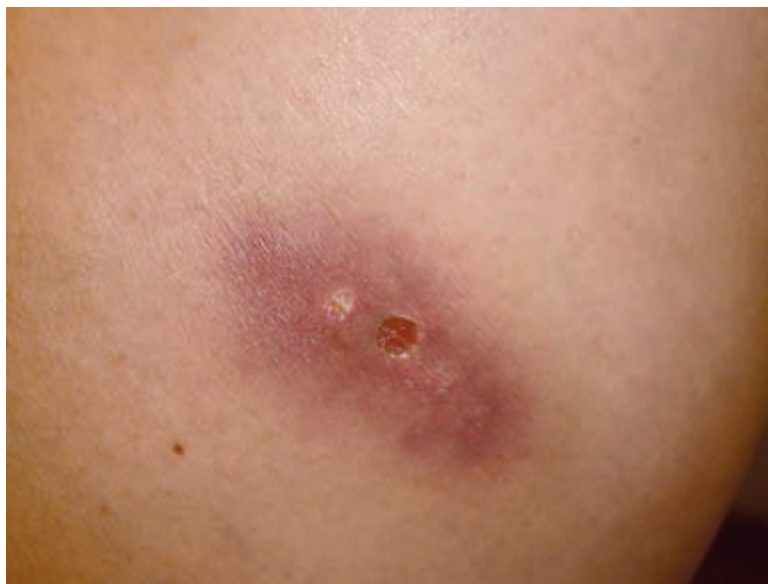
Foto 1. Nódulos eritematosos, algunos fistulizados, en muslo.

El tiempo de tratamiento recomendado es de 4 a 6 meses y el seguimiento es de 6 a 12 meses por el riesgo de recurrencia de las lesiones. 12