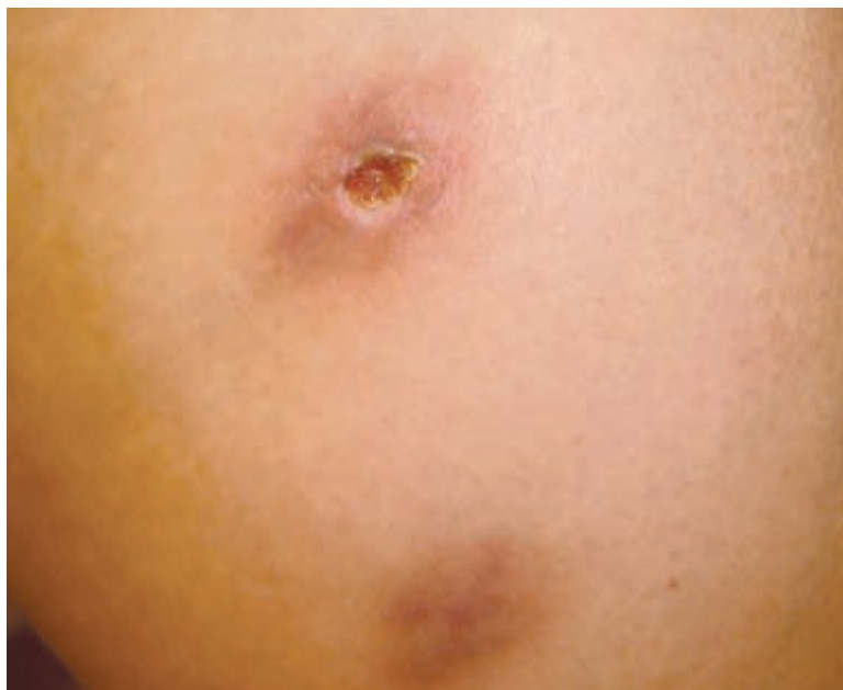
Foto 2. Nódulos con reblandecimiento y drenaje.

En nuestra paciente, se sospechó la participación del Mycobacterium fortuitum , como microorganismo responsable, por la dificultad de su aislamiento y por el antecedente de la mesoterapia.