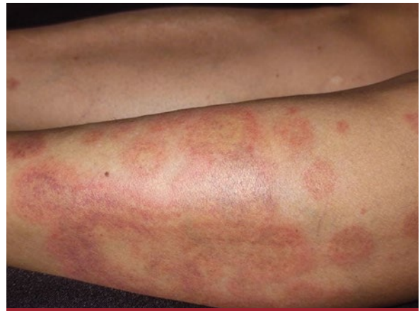
FOTO 1: Placas eritematovioláceas, anulares, en sectores confluentes, que forman placas policíclicas, con centro claro, no descamativas, con límite ligeramente sobrelevado, en los miembros inferiores.

linfocitario moderado, con disposición perivascular “en manguito” (Foto 3). Con los resultados clínicos, el curso evolutivo característico y la histopatología se llegó al diagnóstico de EAC-RA.