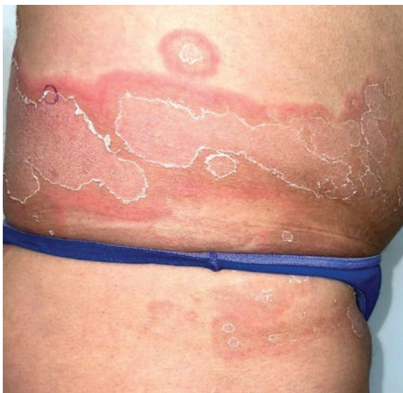
FOTO 5: Placas policíclicas, de límite eritematoso, con escama en el borde interno de avance y centro claro, en el tronco inferior y la raíz de los miembros inferiores.

focitario de disposición perivascular (Foto 6). Debido a las características clínicas e histopatológicas, con el antecedente de la recurrencia estacional de las lesiones, se arribó al diagnóstico de EAC-RA.