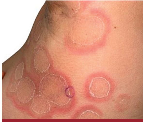
FOTO 4: Placas policíclicas, de límite eritematoso, con escama en el borde interno de avance y centro claro, en la región axilar.