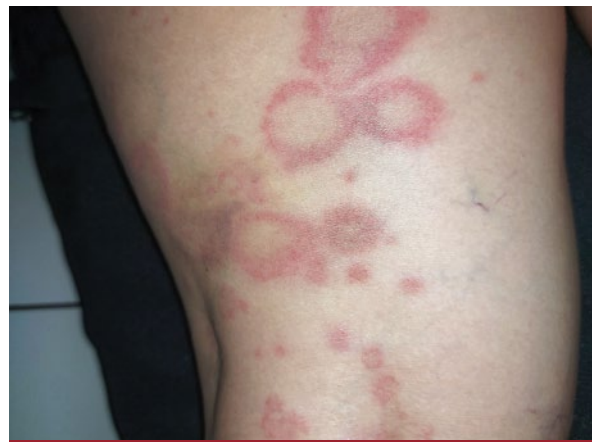
FOTO 2: Placas anulares, con centro claro, límite eritematoso levemente sobrelevado, sin escama, en los muslos.