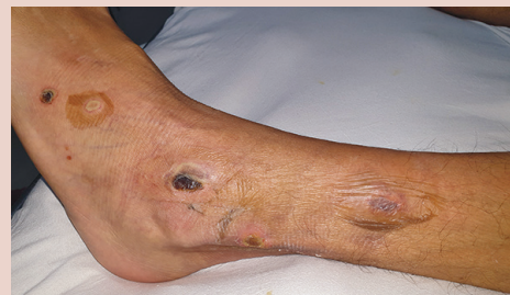
FOTO 3: Luego de una semana de tratamiento antibiótico intravenoso se observan en la pierna izquierda dos ulceraciones con costra necrótica asociadas a ampollas de contenido seroso no destechadas.

El ectima gangrenoso es una piodermitis frecuentemente asociada a septicemia secundaria a Pseudomonas aeruginosa en pacientes inmunodeprimidos. Las localizaciones más frecuentes son las zonas axilares, anogenitales, brazos, piernas, tronco y, en ciertas ocasiones, la cara. El cuadro clínico suele presentarse como máculas que evolucionan a placas, que posteriormente se ulceran. Además, se pueden observar nódulos eritematosos o vesículas hemorrágicas. El diagnóstico se basa en la clínica confirmada con estudios microbiológicos, directo, cultivo, prueba de sensibilidad y biopsia cutánea para descartar otras patologías. Los diagnósticos diferenciales son múltiples y retrasan el inicio del tratamiento específico. Se deben descartar vasculitis, pioderma gangrenoso, calcifilaxis, necrosis inducida por fármacos, embolias sépticas, eritema fijo por drogas, eritema multiforme, entre otros. El tratamiento incluye antibioterapia dirigida y curaciones locales.