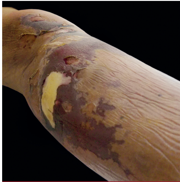
FOTO 2: Se observa el aspecto retiforme de la placa, con un sector de tejido desvitalizado. Cara posterior de la pierna izquierda.