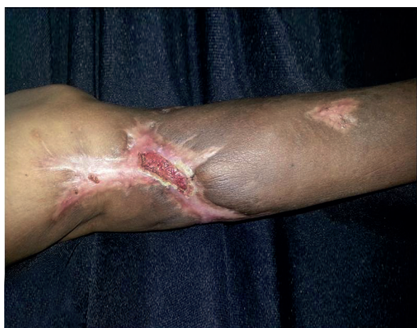
FOTO 4: Cicatrización de aspecto estrellado, con una úlcera de pequeño tamaño central luego de 2 meses de tratamiento.