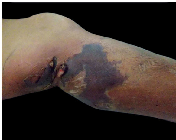
FOTO 1: Placa purpúrica retiforme con sectores de necrosis. Cara lateral interna de la pierna izquierda.

A los 6 meses de tratamiento, la paciente murió por un cuadro de sepsis con foco abdominal, posterior a una colecistectomía.