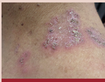
FOTO 2: Placa eritematoescamosa en la zona lateral del cuello.