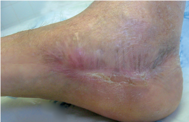
Foto 3. Cicatriz en el borde interno del pie derecho donde fue el traumatismo.