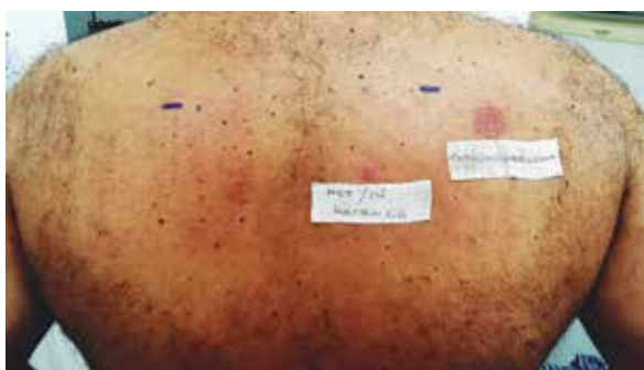
FOTO 4: MCI y MI suelen estar presentes como conservantes de pinturas.