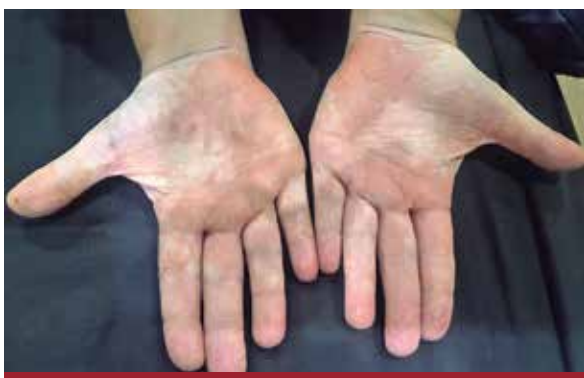
FOTO 3: Dermatitis de contacto ocupacional en ambas manos de un pintor.