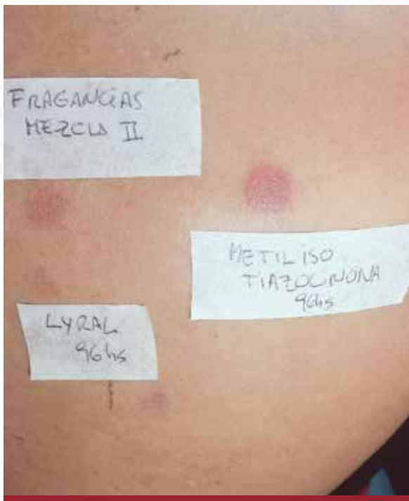
FOTO 7: Reacciones positivas a fragancias y a metilisotiazolinona presentes en el filtro solar.