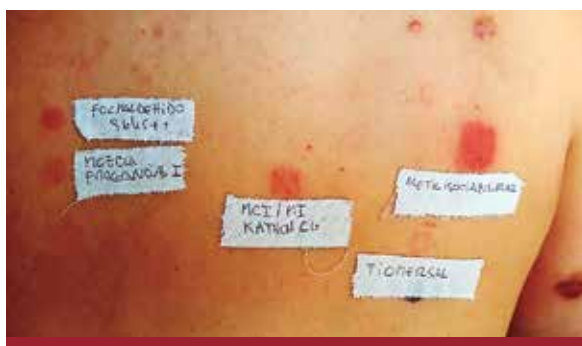
FOTO 2: Prueba del parche de la paciente anterior. Obsérvese la sensibilización a distintos conservantes.