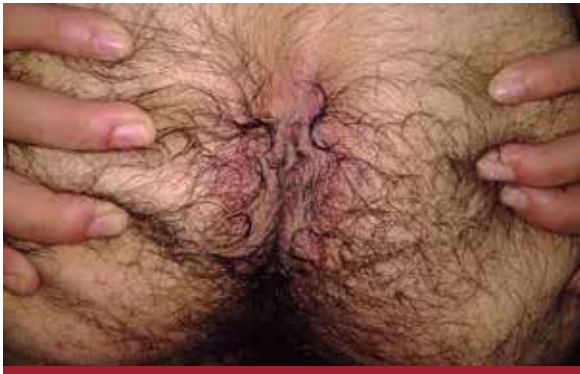
FOTO 1: Lesión ulcerocostrosa en la región perianal.