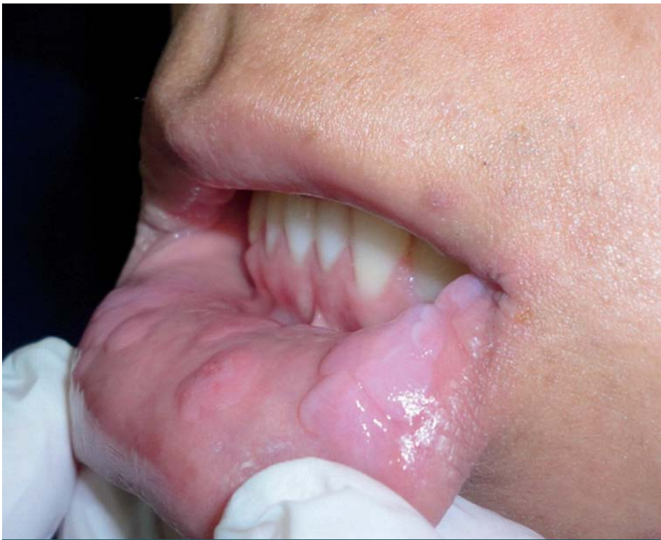
FOTOS 1 y 2. Múltiples pápulas cubiertas por mucosa normal localizadas en cara interna de labios y carrillos y verrugosidades en comisura labial derecha.