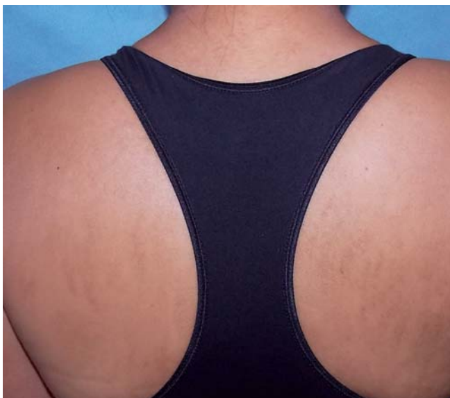
FOTO 1. Caso 1: dermatitis flagelada secundaria a bleomicina. Máculas hiperpigmentadas lanceoladas.

Paciente de sexo femenino de 27 años de edad con diagnóstico de linfoma de Hodgkin (LH), que concurrió a la consulta durante el segundo ciclo de quimioterapia con doxorubicina, bleomicina, vincristina y dacarbazina. Presentaba dermatosis de días de evolución, localizada en tronco, muslos y miembros superiores, caracterizada por placas eritematosas con distribución lineal, pruriginosas. El estudio histopatológico mostró sección cutánea con degeneración vacuolar de la capa basal y presencia de aisladas células apoptóticas; discretos infiltrados inflamatorios predominantemente linfocitarios que incluyen melanófagos de disposición perivascular superficial. Hallazgos compatibles con dermatitis de la interfase de tipo vacuolar (foto 3). Se indicó meprednisona 30 mg/día durante dos semanas, con buena respuesta. Evolucionó con remisiones y exacerbaciones relacionadas con la administración de la bleomicina y máculas residuales hiperpigmentadas.